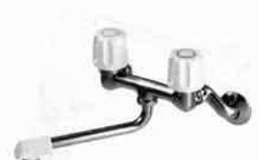
ツーバルブ混合栓